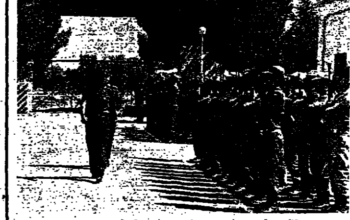
قائد وقسم ريات يستعرض وحدة عسكرية